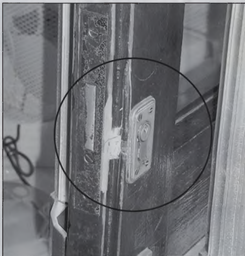
Pany forçat de la botiga.

En el que va d'any a Sant Hilari ja s'han comès deu robatoris.