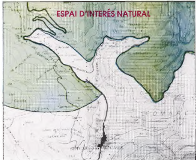
PROJECTE EN TRÀMIT D'APROVACIÓ