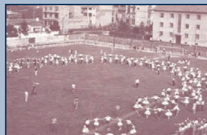
1ª Edició de Concurs de Colles - Any 1969