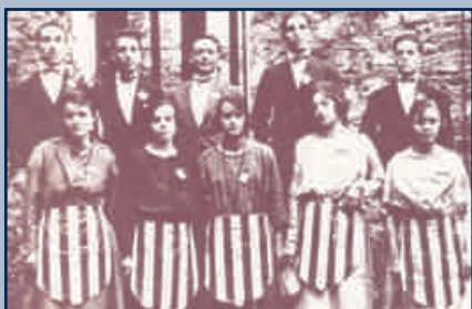
Colla Sardanista Santjoanina - Any 1910