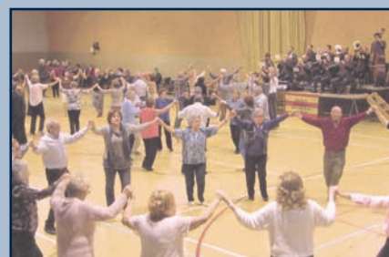
Sardanes al Pavelló, en motiu de la castanyada