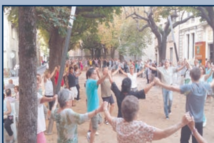
Sardanes al Passeig - Diada de Germanor