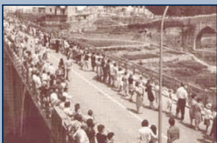
Gran sardana dels dos ponts - Any 1976