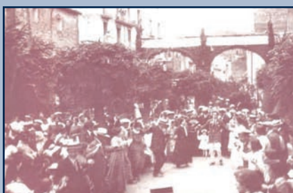
Audició de sardanes al Passeig - Any 1915