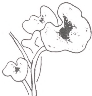
Portada del quadern de camp de l'Escola de la Natura