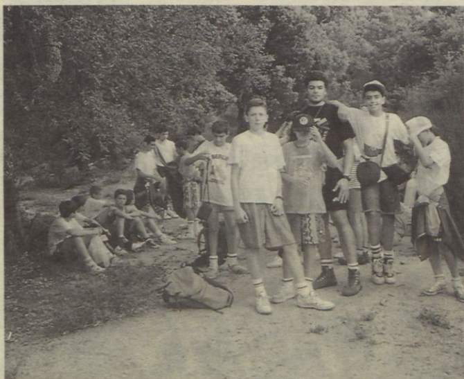
Descansant en el Coll de Calabuig.