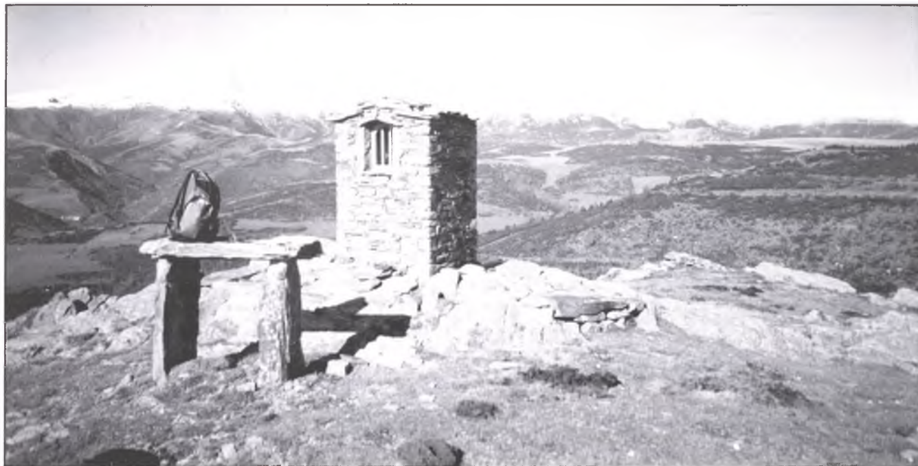
Al fons, vers el nord, els cims nevats de: Costabona, Pla Guillem i Massís del Canigó.