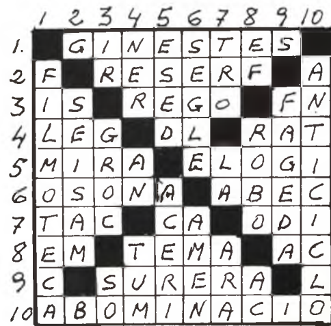
Solució al núm. 25

1.- Cim de la Garrotxa. 2.- Vocal. Extranya. Mil. 3.- Al revés cent cinquanta. Malaltia de caire al·lèrgic. Al revés metall. 4.- Al revés, dolència. Vocals. Al revés, planta comestible. 5.- Part de l'ull. Incandescent. 6.- Acció de l'home digue de premi. Delicte greu. 7.- Al revés, moviment de l'aigua. Déu egipci. Exclamació. 8.- Part del cos. Serra de la Vall. Al revés, pronom personal. 9.- Vocal. Delicadesa. Cardinal. 10.- Omplir i buidar cabassos.