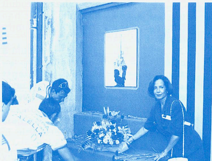
L'11 de setembre

-L'enlairament d'un globus aerostàtic, el qual suscità gran expectació entre el públic que visitava la Fira.