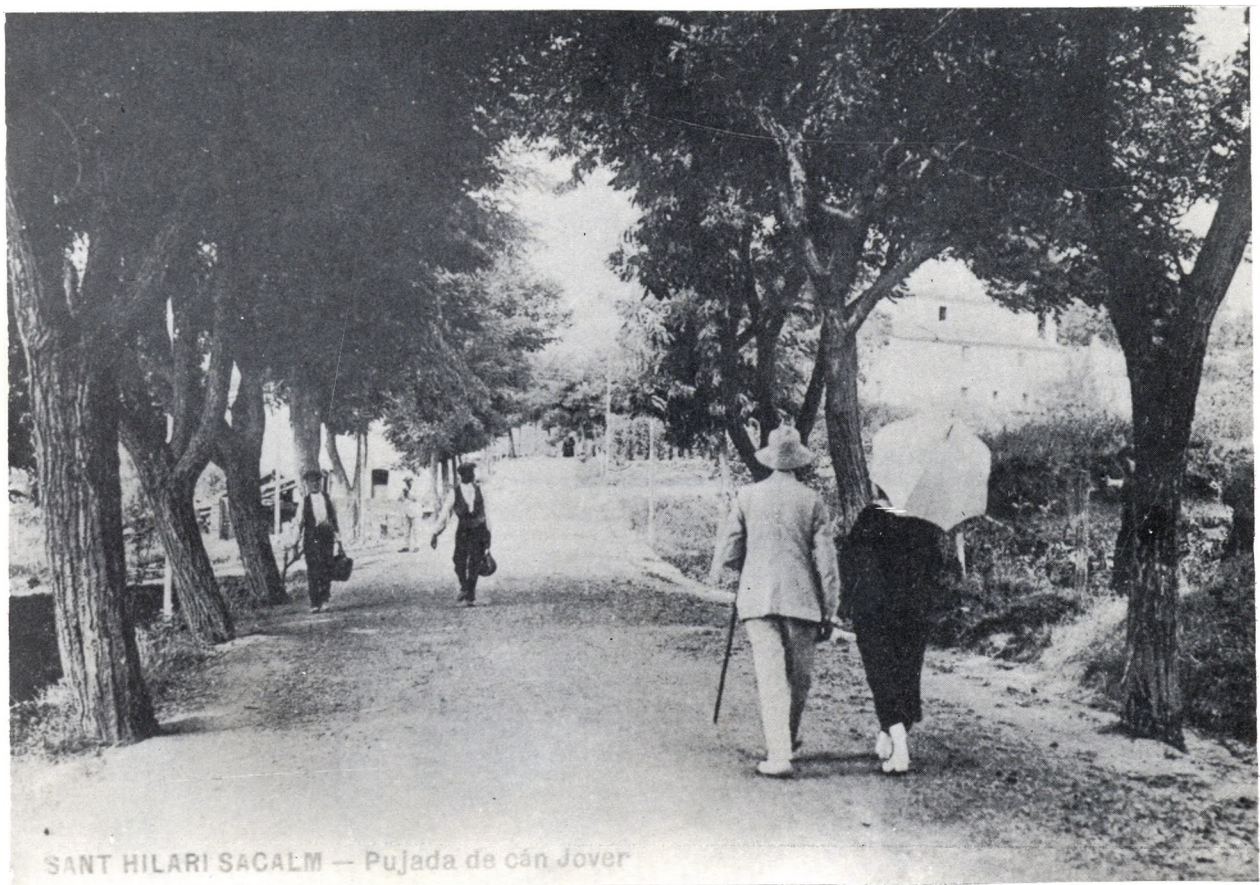
SANT HILARI SACALM — Pujada de can Jover