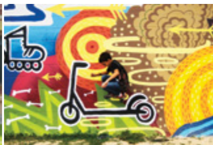
Premi juvenil a la millor fotografia del tema B: Irene Oliveras . Premi: material fotogràfic per valor de 50 €. Patrocinat per Copisteria Cassà.