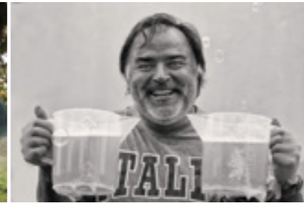
Premi a la millor fotografia del tema 3 (categoria adults): Josep Lois . Premi: 200 €. Patrocinat per l'Ajuntament de Caldes.