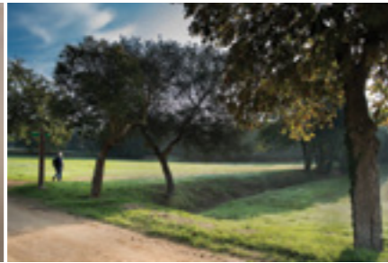
Premi a la millor fotografia del tema 2 (categoria adults): Xavier Xaubet . Premi: 200 €. Patrocinat per Hotel Camiral.