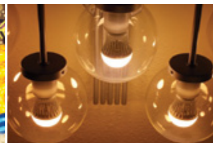
Premi juvenil a la millor fotografia del tema C: Aniol Carreras . Premi: material fotogràfic per valor de 50 €. Patrocinat per l'Ajuntament de Caldes.