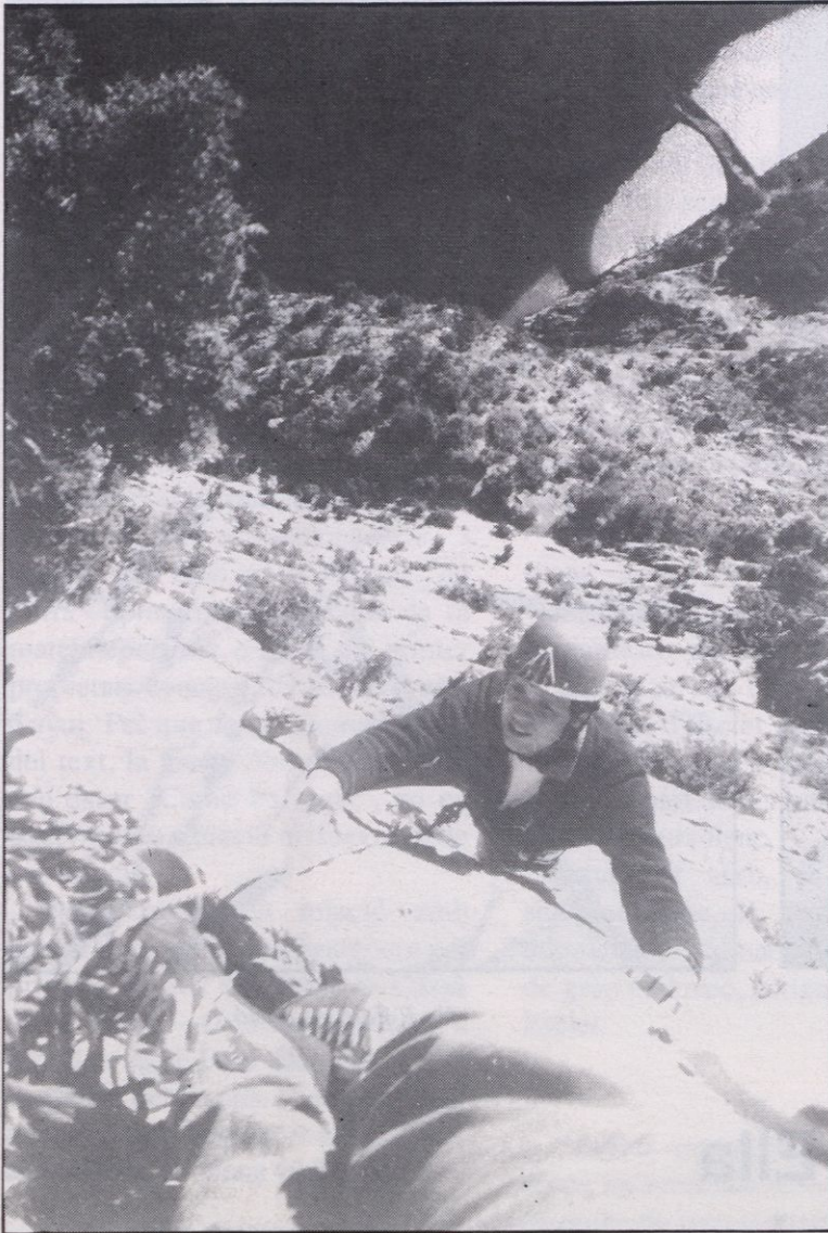
Arribant a la segona reunió.