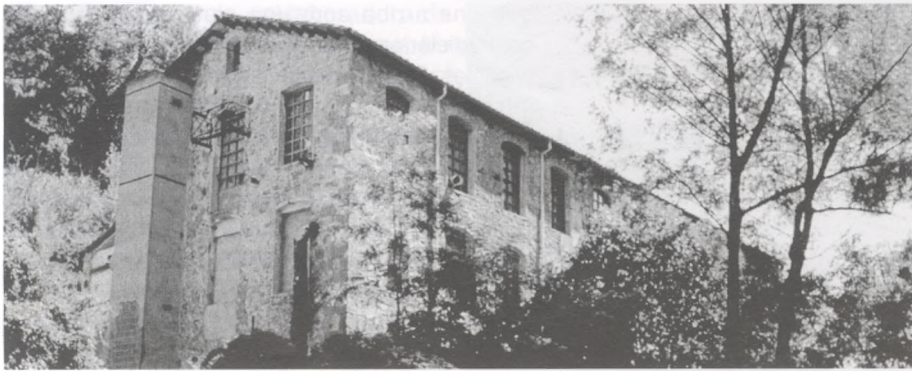
L'antiga fàbrica de "Can Pixola" un dels principis de la nostra tradició empresarial i seriositat obrera

“ Quan l'equip de redacció de la revista a 440 m em varen convidar a participar en el seu projecte editorial em vaig sentir molt feliç i il·lusionat de tornar a la meua tasca més arrelada: el periodisme de casa nostra. La meua corresponsalia taurina internacional per Europa i Amèrica, integrat en el grup de corresponsals de catalunya, no em dóna pas tantes satisfaccions com les que he rebut de la nostra gent. Després de tenir-me molts anys a la cuneta, ara em tornen a acceptar en els mitjans de comunicació comarcals. I la gent que no militem en cap organització política, sovint parlem de temes que no surten als papers amb les opinions i preguntes que nosaltres ens plantegem. Per això tinc la intenció de tocar-los - tot i que poden aixecar ampolles - en els meus futurs articles i dins d'aquest mateix espai. ”