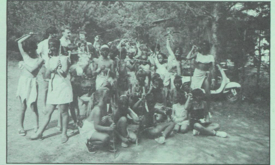
Guaita! Vénen els indis.