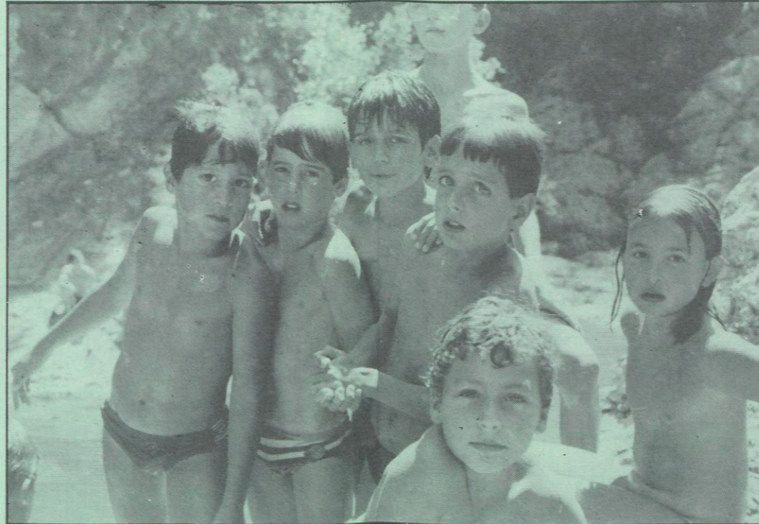
Quin és el més guapo?