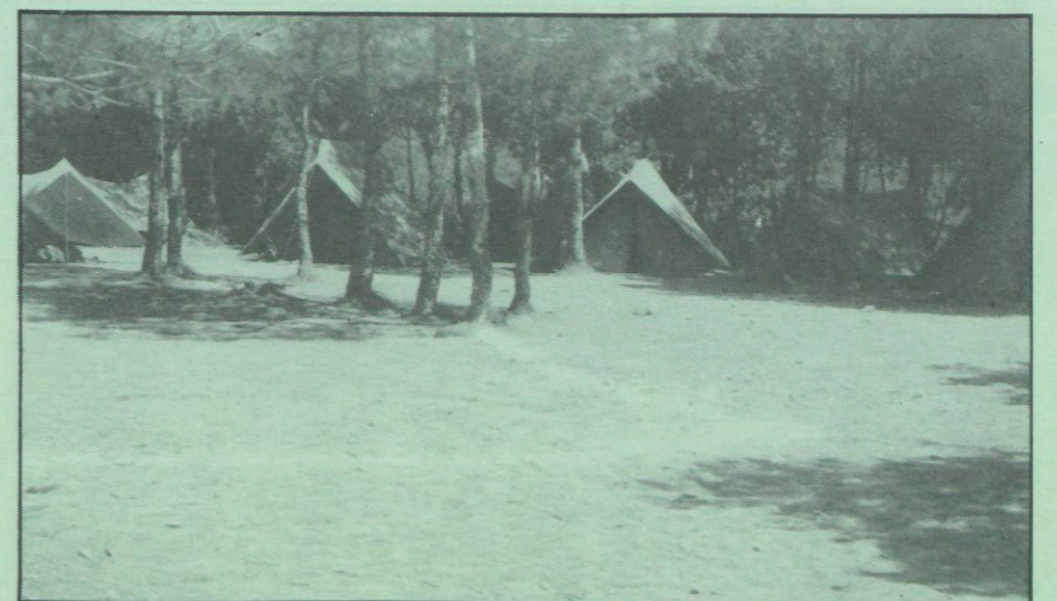
Les tendes estan en repòs...