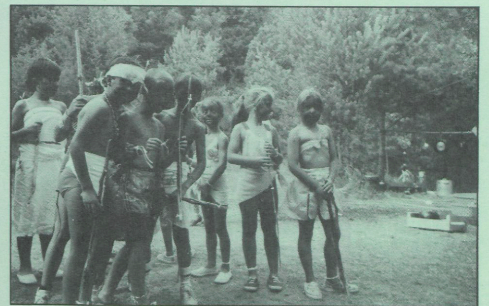
I encara més indis...