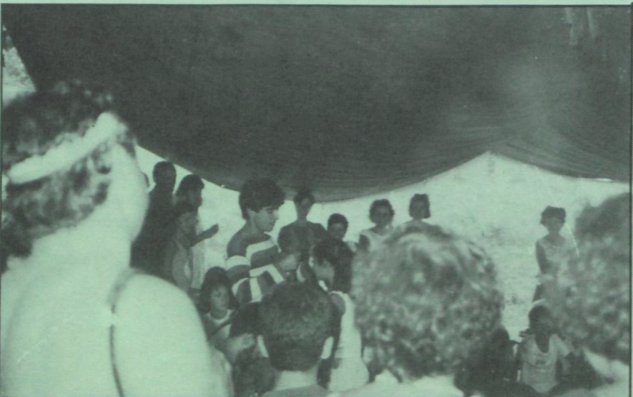
i més medalles.