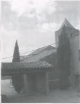
Romanyà de la Selva