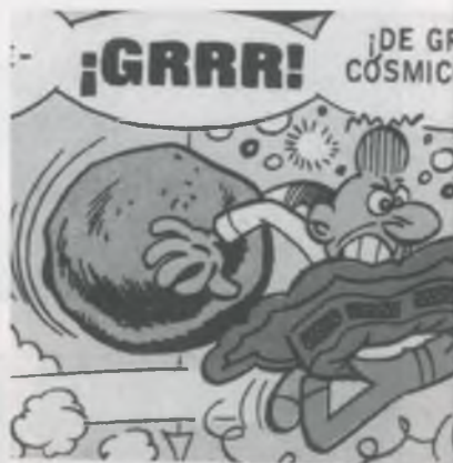
MORTADELO Y FILEMÓN, 50 AÑOS A MAMPORROS

El vint de gener de 1958 surt la primera historieta de Mortadelo y Filemón al número 1394 de la revista Pulgarcito . A partir d'aquí, i durant els anys seixanta, Ibáñez publica en