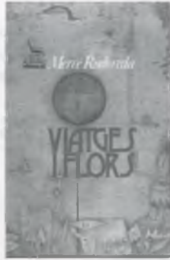
Morí el 13 d'abril en primavera