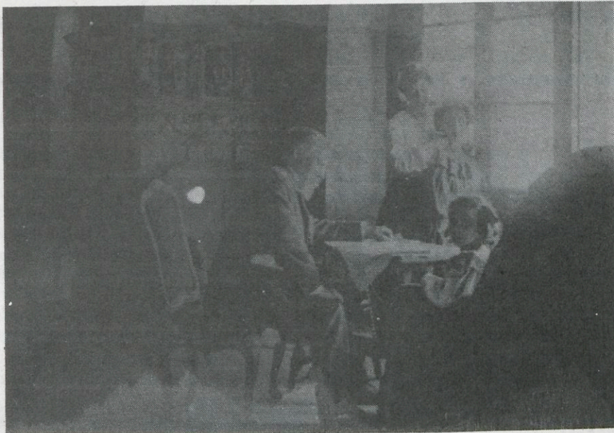
Una estampa familiar de l'arquitecte Comalat.