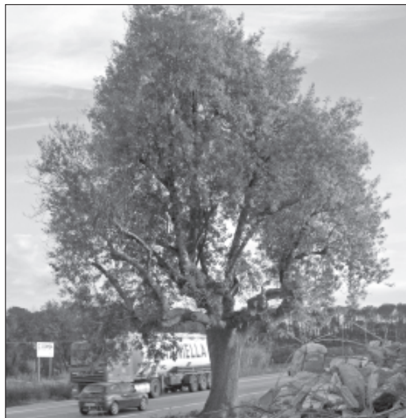
El freixe que es trasplantarà