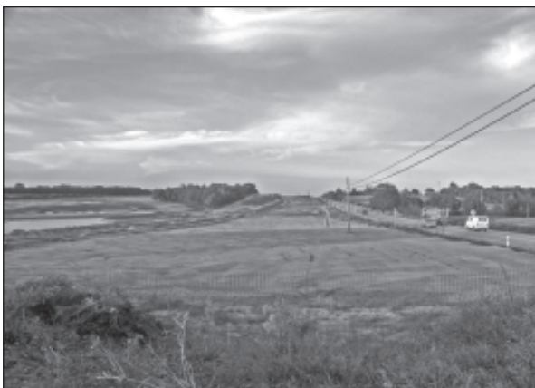
El terreny per on ha de passar la nova via

L'Ajuntament ha arrancat de Foment el compromís de trasplantar el freixe de Can Geli, catalogat com a arbre monumental. L'arbre hauria d'haver-se tal·lat a causa del desdoblament de l'N-II però el valor de la planta ha fet que se'l traslladi de lloc properament en un lloc encara per determinar.