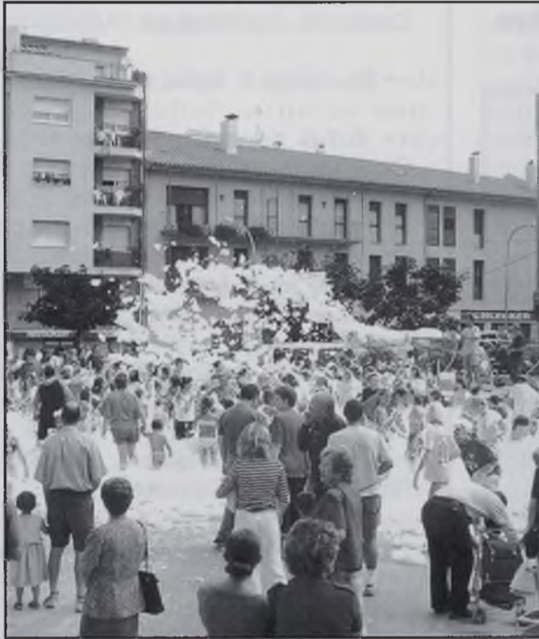
Ball de l'escuma

El diumenge, últim dia de festa, hi va haver una exhibició de puntaires on hi participaven les puntaires de Sant Hilari