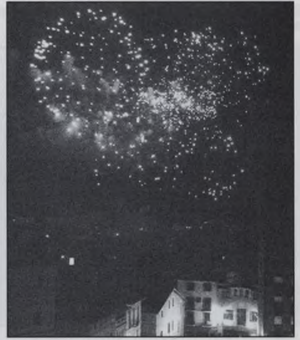
Castell de focs artificials

A la tarda es va fer l'actuació dels mariachis a la