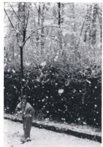
Tant per la quantitat com per la mida de les ballerusques, el mes de maig passarà a la història metereològica de la Vall.