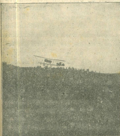
(II. - Als 10 segons)