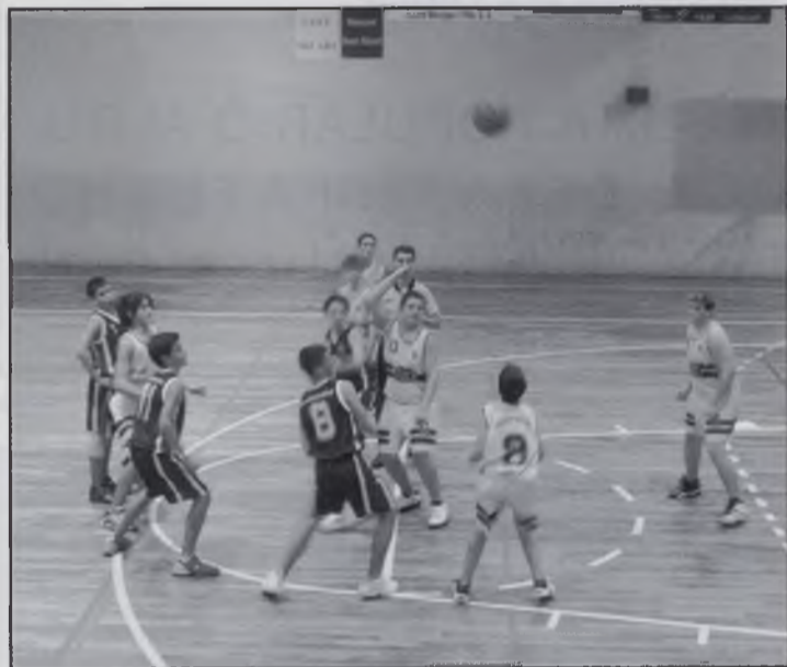
Sortida de salt en el partit del cadet masculí.