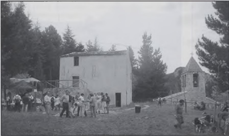
Esmorzar a l'Ermita.