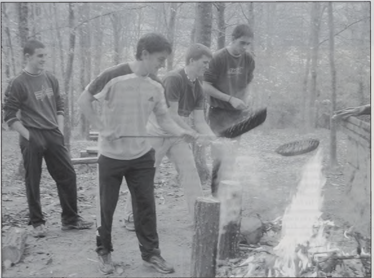
Un grup d'alumnes torrant castanyes.

IES Guillerries prepara una ginkama el dijous a la tarda al pavelló esportiu on hi participen tots els alumnes