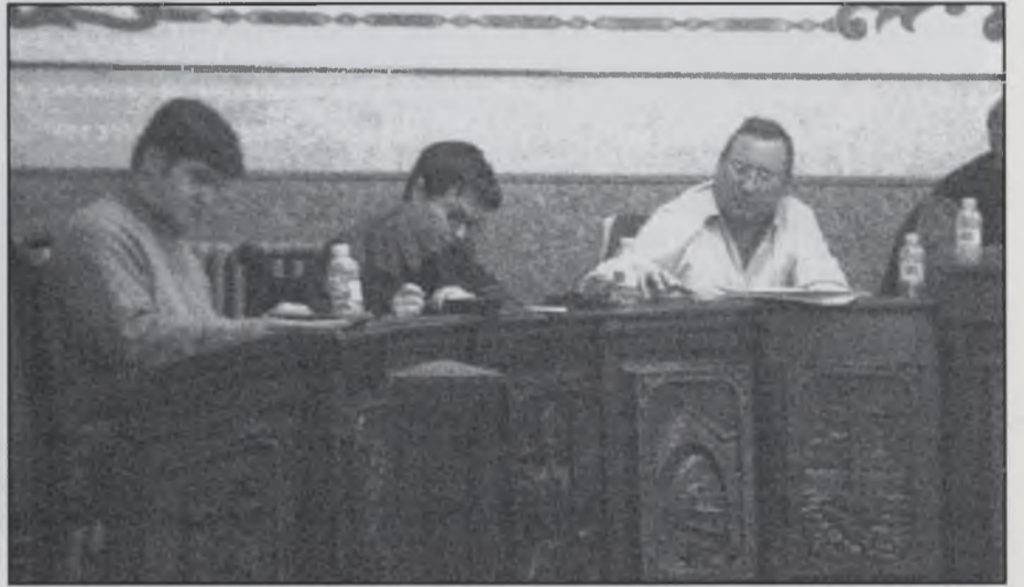
Ple del mes de març