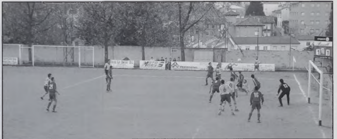
Sortida de la banda.