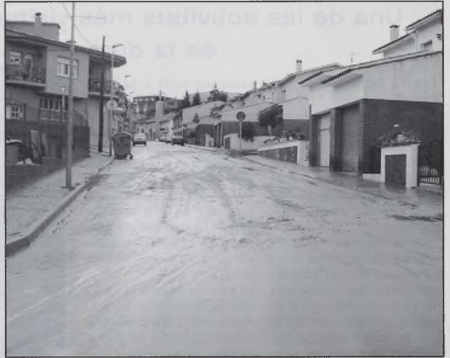
Carrer Sant Jordi el dijous.

Cada hora que assenyalo, t'allunya més del bressol i t'acosta a la mortalla.