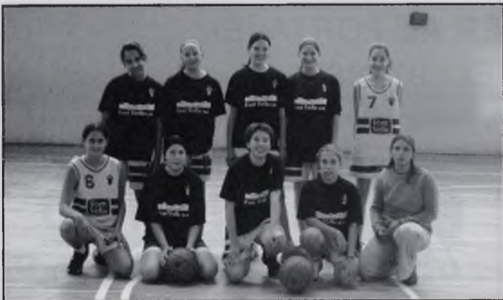
Cadet femení A