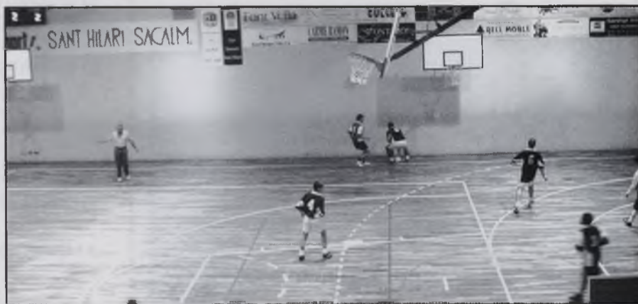
Partit Sant Hilari - Ripoll

del primer partit de lliga, va dominar el partit des de l'inici, i a mitjans de la primera part ja guanyava per 3 gols a 0. El domini va seguir durant tota la primera part i es va arribar al descans amb un clar 5 a 1. En la segona part es mantenia la superioritat local, i el partit va acabar amb un contundent 10 a 2. El partit va registrar una gran aflluència de públic, i el poliesportiu municipal estava gairebé ple per presenciar el partit.