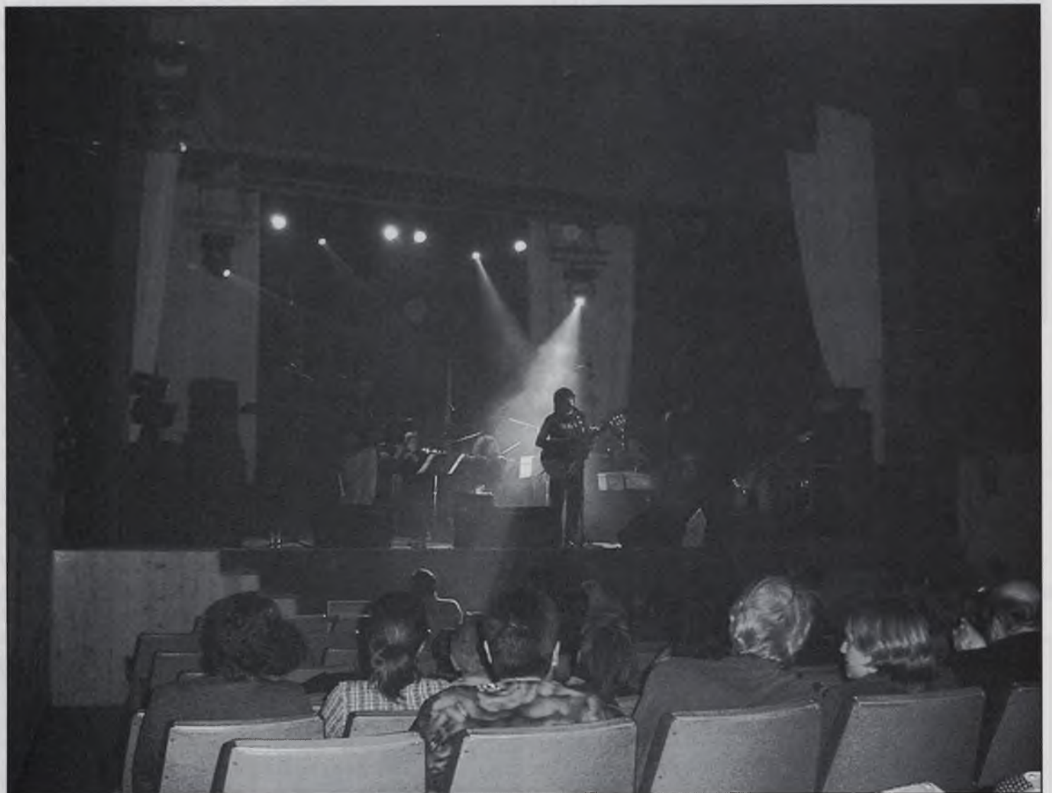
Concert de Pep Sala

La primera fira del bolet a Sant Hilari finalitza amb un gran ventall d'activitats on hi pot participar tothom