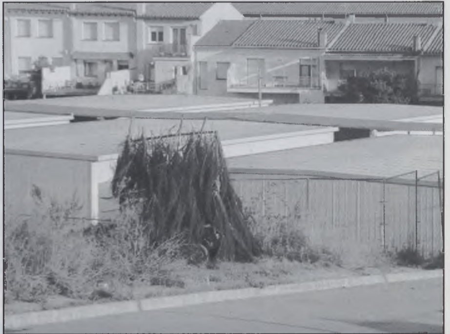
Els barracons de l'IES Sant Hilari

Tot i la polèmica que hi ha hagut durant aquests últims dies si els escolars han de fer més o menys dies de vacances, el primer dia d'escola es va desenvolupar amb tota normalitat. L'únic centre que no ha com-