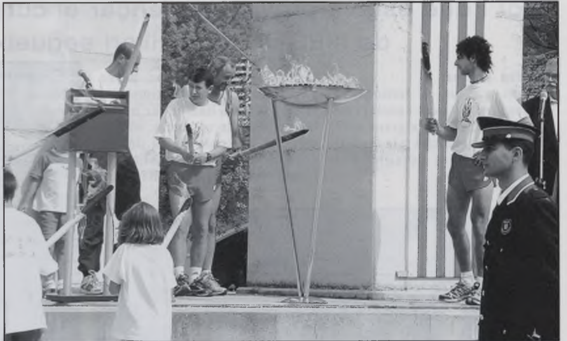
Lloc per on van accedir a l'interior de l'establiment

Un cop finalitzada l'ofrena floral l'alcalde de Sant Hilari va dirigir unes paraules al públic i es va referir als atemptats de l'11 de setembre dels EE.UU. També va voler recordar la figura del General Moragues ja que és un hilarienc que va lluitar pel seu poble,