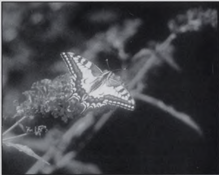
La papallona