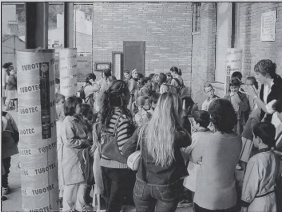
alumnes del Col·legi Sant Josep.

plet les seves perspectives és l'IES de Sant Hilari ja que esperaven poder començar el curs escolar en el nou institut que estarà ubicat als Campaments de Sant Hilari. De moment els alumnes de l'institut de Sant Hilari han iniciat