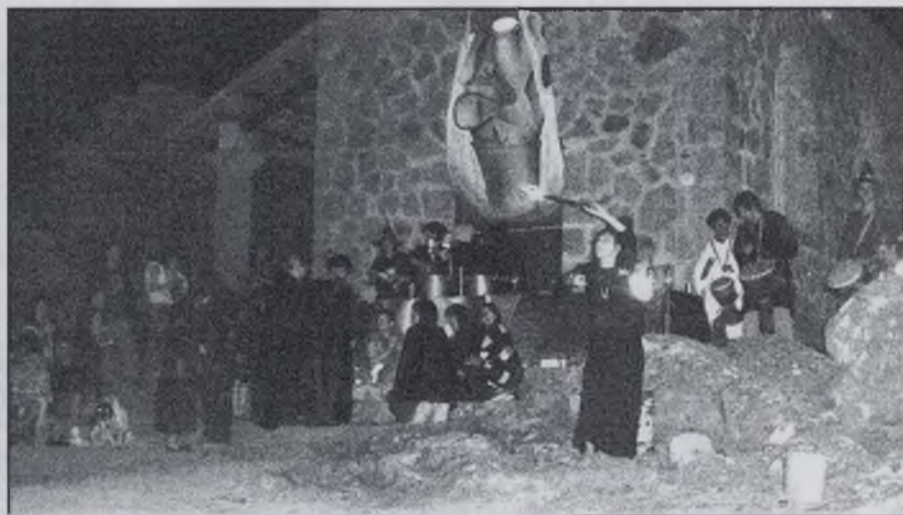
Bruixes i bruixots al Nen Jesús de Praga