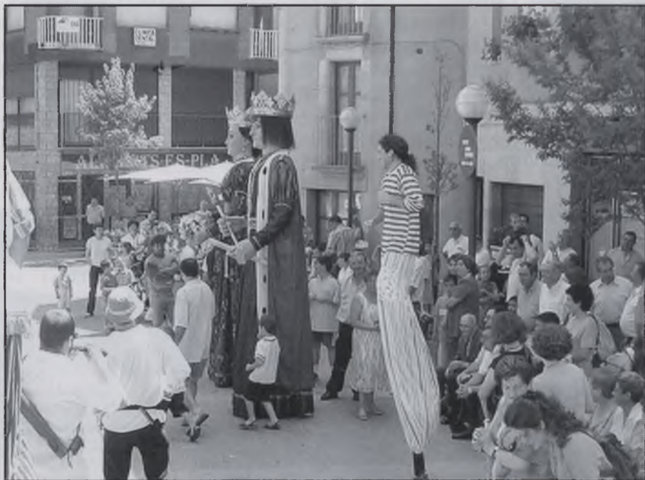
Els grallers animen al públic.

190 persones assisteixen al dinar de l'homenatge després d'escoltar la missa amb Mossèn Carles i Mossèn Mas