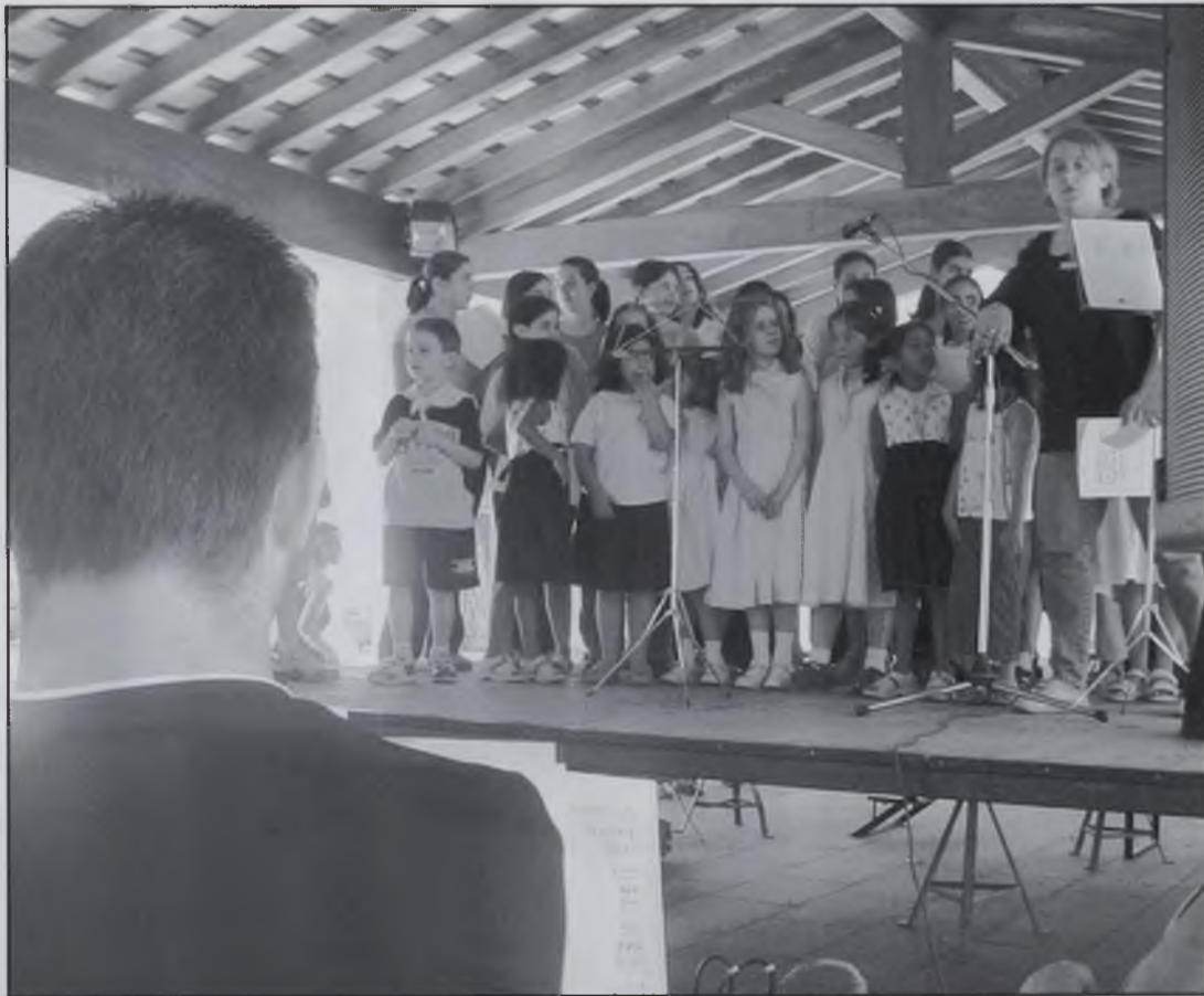
Petits Cantaires acompanyats amb l'orga