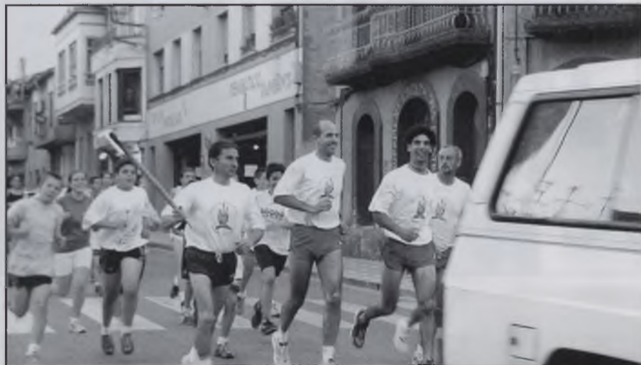
Els atletes porten la Flama del Canigó.