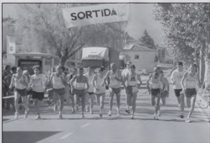
Cursa dels veterans.