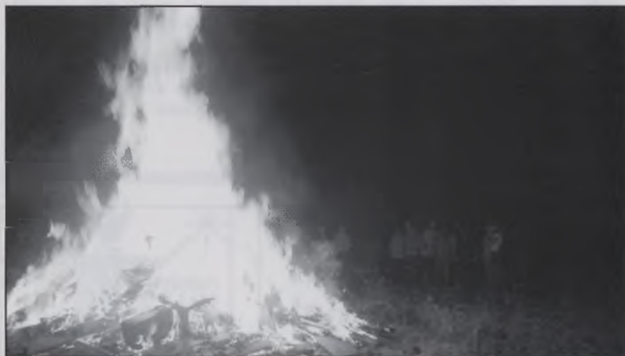
Una foguera de Sant Hilari