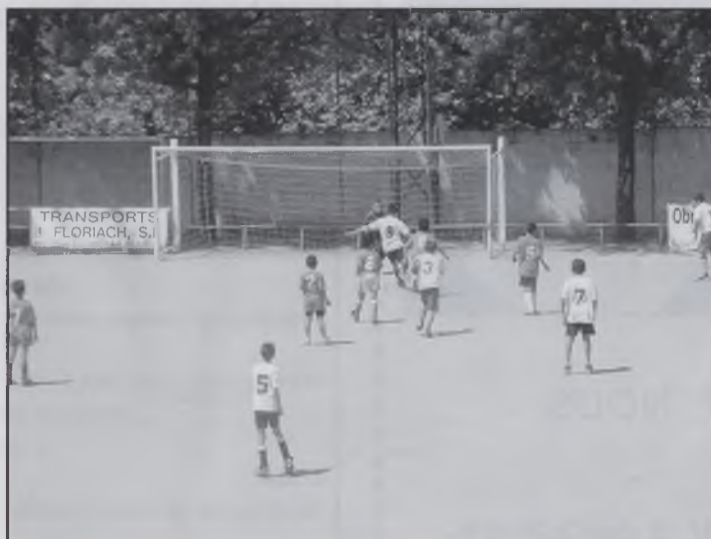
Partit de futbol 7

En el grup de grans la classificació va ser: primers, Els boixos , segons, l'Inter Craks i tercers, Isards en acció .