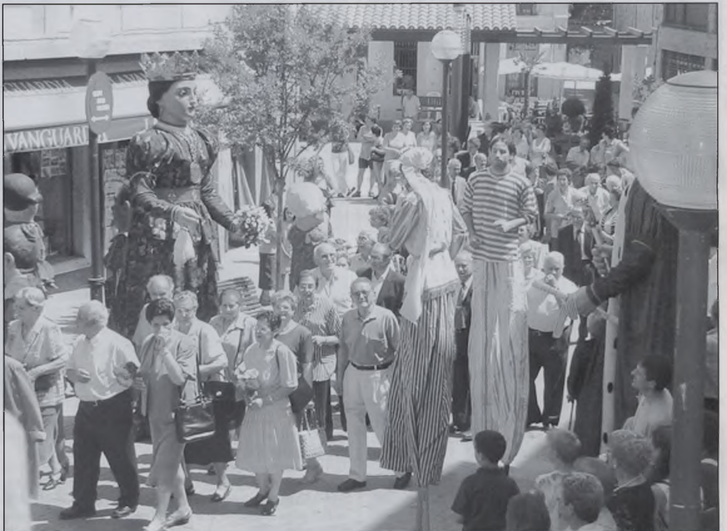
Arribada a l'església pel 56è aniversari.