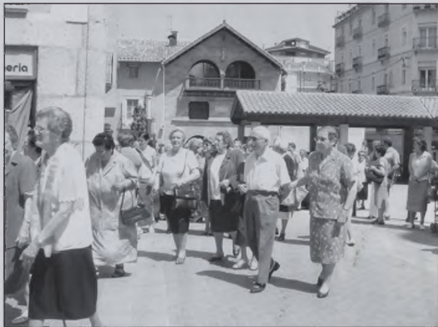
Arribada a l'església pel 56è aniversari.