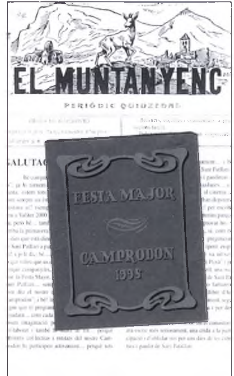
▲ "El programa de les festes que aquest any sortia en format d'El Muntanyenc"

Recordo que quan era petita i estava a escola i la gent em preguntava d'on era, tot-hom deia: "del poble de les bones galetes!" Després, de més gran, la gent deia: "ah, del poble de les galetes, de les llançonisses i de les pells". I ara, des de fa ja molts anys, la gent diu: "oh, quin poble tan bonic". I és que el nostre poble cada vegada més és conegut arreu del món per