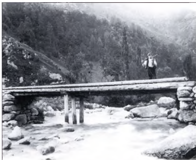
▲ “El Pont d'en Gepet, l'any 1920. A baix el mateix pont tal com era abans de la construcció del mur.”

Al llarg de la història tenim notícies d'aiguats que, per a casa nostra, han estat catastròfics: el del 3 de novembre de 1617; el de Santa Tecla, ocorregut la nit del 22 al 23 de setembre de 1874; el Francolí, a Tarragona (a Montblanc hom parla de 348 l/m 2 ), i el Llobregat, a Barcelona, arrassaren; i el diari Roussillon , de Perpinyà, ens parla de les pujades de la Tet i de l'Aglí; per proximitat, podem incloure-hi també el Ter -les inundacions del 12 al 14 d'octubre de 1907, i que es repetiren els dies 21, 22 i 23 del mateix mes, foren notables- (en la col·lecta que organitzà la Diputació