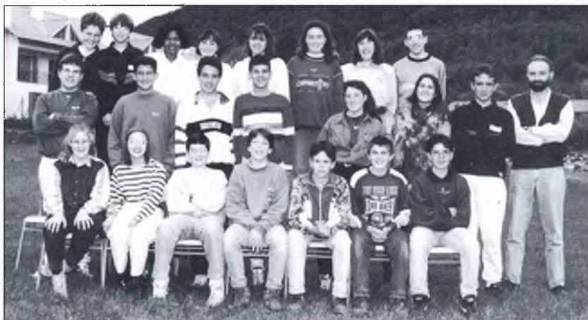
▲ “El curs de vuitè d'enguany, que quasi és la meitat de nombrós del que publicavem als primers números de El Pont Nou ”

Un altre any , una altra fornada d'estudiants que acaben vuitè i que comencen a escampar-se arreu. Uns continuant els seus estudis d'ESO, altres a formació professional, al final no tots seguiran a la vall. Alguns, normalment els més qualificats, ja no tornaran si no és per vacances. ■