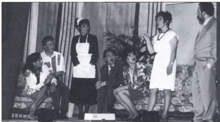
▲ “Una escena de la comèdia”