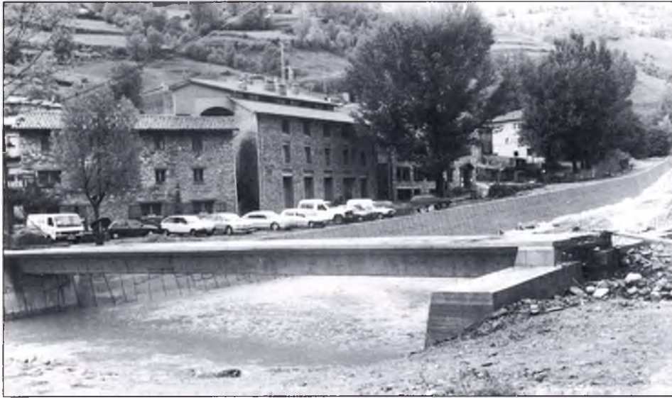
◀ “Una imatge del mur amb el Pont d'en Gepet, tal com es pot veure actualment.”

de Barcelona, la Societat Coral de Camprodon hi col·laborà amb 157 pessetes); l'aiguat de Sant Lluç, la nit del 18 al 19 d'octubre de 1930; i molt més recent -i probablement un dels més importants-, el del mes d'octubre de 1940, i que es repetí, amb molta menys intensitat, l'any 1941: els dies 17, 18 i 19 d'octubre d'aquell any s'enregistraren, només a Setcases, 798 l/m 2 , el que representa que, durant aquests tres dies caigueren sobre el nostre municipi ni més ni menys que 39.102.000.000 litres d'aigua. Aquesta xifra parla per si sola. La riuada s'emportà tota una filera de cases, on hi havia una cabanya de'n Jepet, una altra de l'Oliver, la casa i la cabanya de can Perejan, la cabanya de'n Brusset, el molí de'n Perejan i un cabanyot de'n Tiranda.