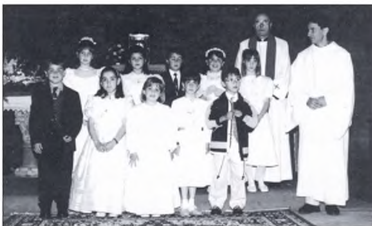
◀ “Els com-bregants de Camprodon, el primer diumenge de juny”