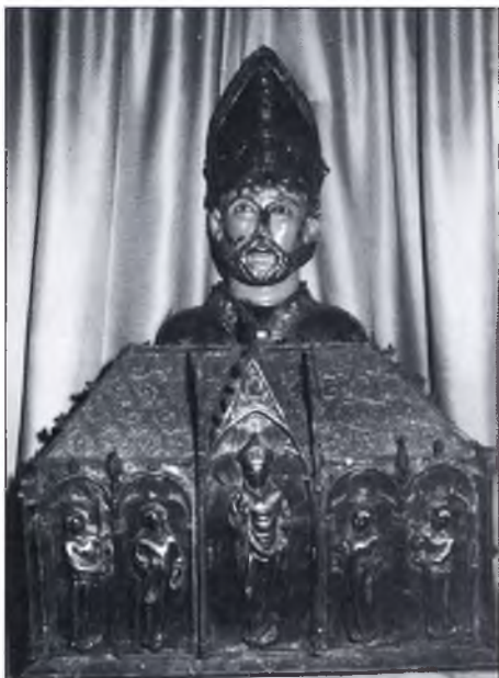
▲ “Relicari i bust de sant Patllari, sant patró de Camprodon”

cisellades que recorden els alts fets del gloriós confessor de la fe, i cada any, els exposaven a la veneració dels fidels. L'any 1470 s'encengué la guerra entre França i Espanya. Les tropes franceses es van fer mestresses de Camprodon, van destruir les muralles, i lliuraren la vila al pillatge. El cos de sant Patllari, guardat a l'urna d'argent, fou portat a Perpinyà i després a Carcassona, i més tard al castell de Chatillon.