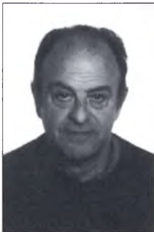
▲ "Andreu Giralt i Costa, alcalde de Vilallonga de Ter"