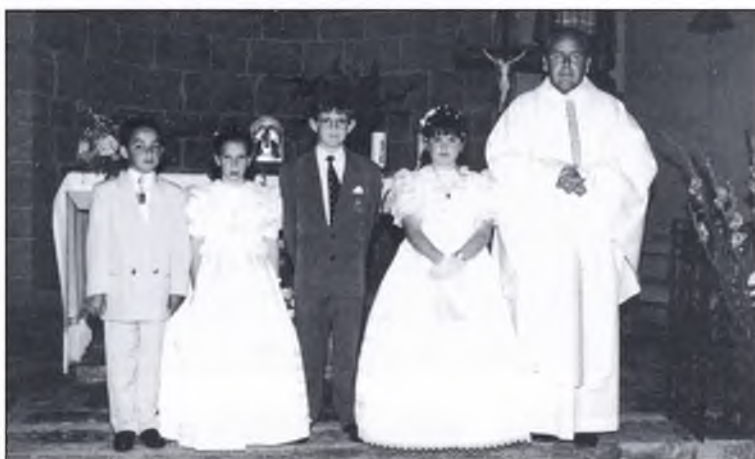
◀ “Una vista de la primera comunió a Vilallonga”

Cada any , a finals de la primavera, normalment el mes de maig, a totes les parròquies de la vall se solen celebrar les comunions. De Camprodon i de Vilallonga ens n'han fet arribar unes instantànies. ■