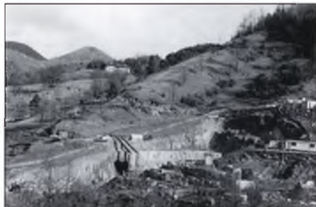
▲ "Les obres del Túnel tal com estaven a principis de 1993"