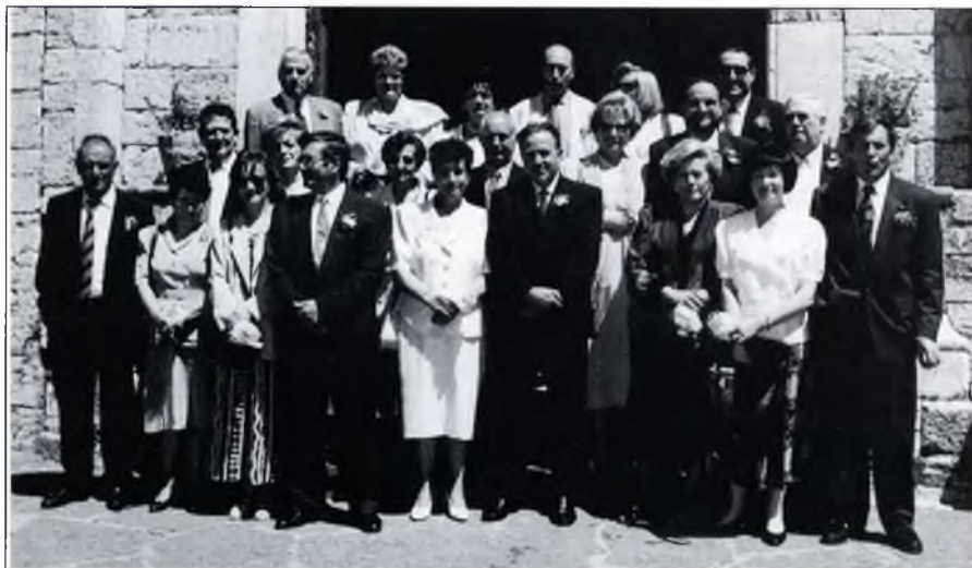
▲ "La colla del 69, o sigui les parelles que aquest any '94 ha celebrat els 25 anys de matrimoni, davant de l'església de Santa Maria de Camprodon".

Aquest any els ha tocat als qui van celebrar noces el 69, i a la il·lustració els podem veure fent pose davant del portal de l'església de Santa Maria de Camprodon, i donant lloc a, el que d'aquí a vint o trenta anys, pot esdevenir una magnífica foto nostàlgica. Des d'EL PONT NOU donem a tots les nostres sinceres felicitacions ■