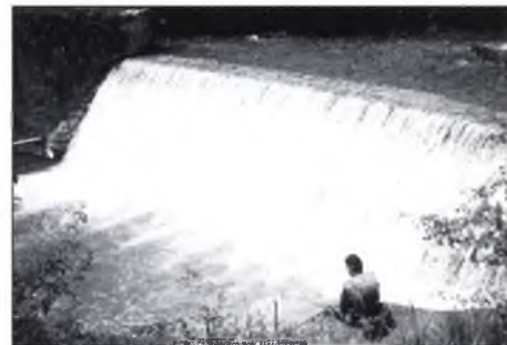
▲ “La resclosa del Ter a la Colònia, un estiu normal”.

Un cop feta l'adjudicació, només queda el tràmit de l'acta de replanteig, i un cop efec-