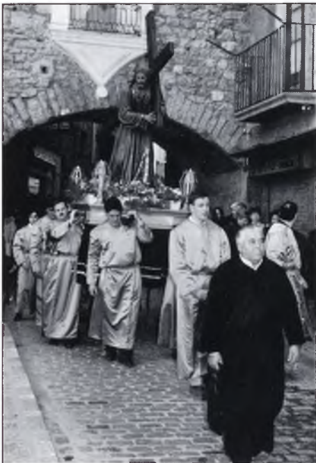
▲ La processó de les dones, sota el Pont Nou.

▲ "Una divertida colla de Hare Cristnas, surt malgrat la pluja i a manera de cercavila, per tal d'animar els indecisos".