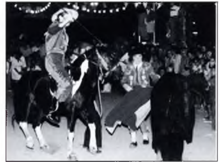
▲ "L'estil del torero i dels picadors era d'allò més convincent"