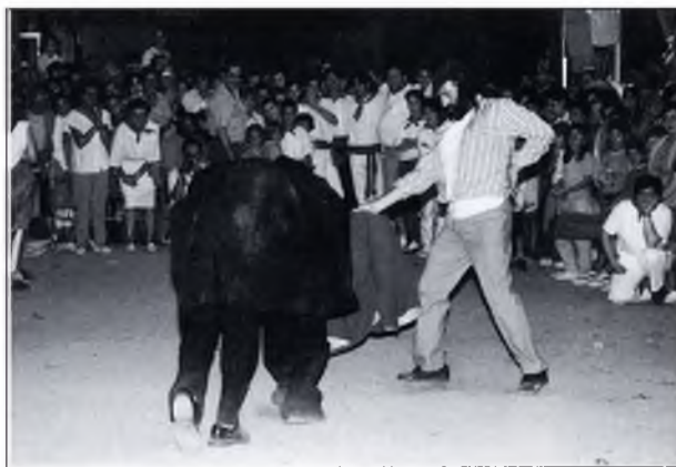
◀ "Tampoc hi podia faltar la presència d'un arriscat espontani".