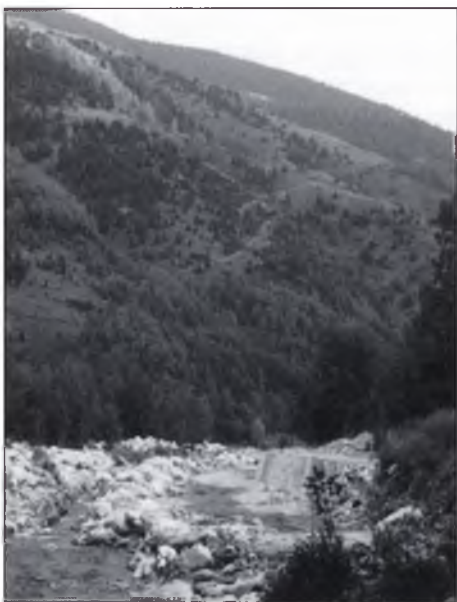
▲ “Estat actual de les obres del desviament de la carrera a l'estació d'esquí, al seu pas per Setcases”

Si, a la Vall, alguna obra pública era realment apremiant, aquesta era la de la variant de Setcases. Els caps de setmana amb l'estació d'esquí a ple funcionament donaven una imatge de caòtica improvisació, impròpia d'un país que pretén estar a la vanguardia de la modernitat. I és que, l'endrés i eficàcia d'un país, com la d'un jardí o d'una empresa no s'ha de mesurar per les grans obres de façana o itinerari