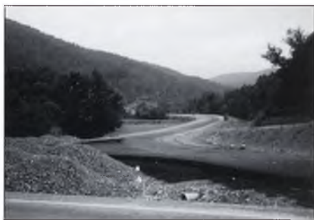
▲ "Les obres en el seu estat actual, a punt de ser inaugurades."