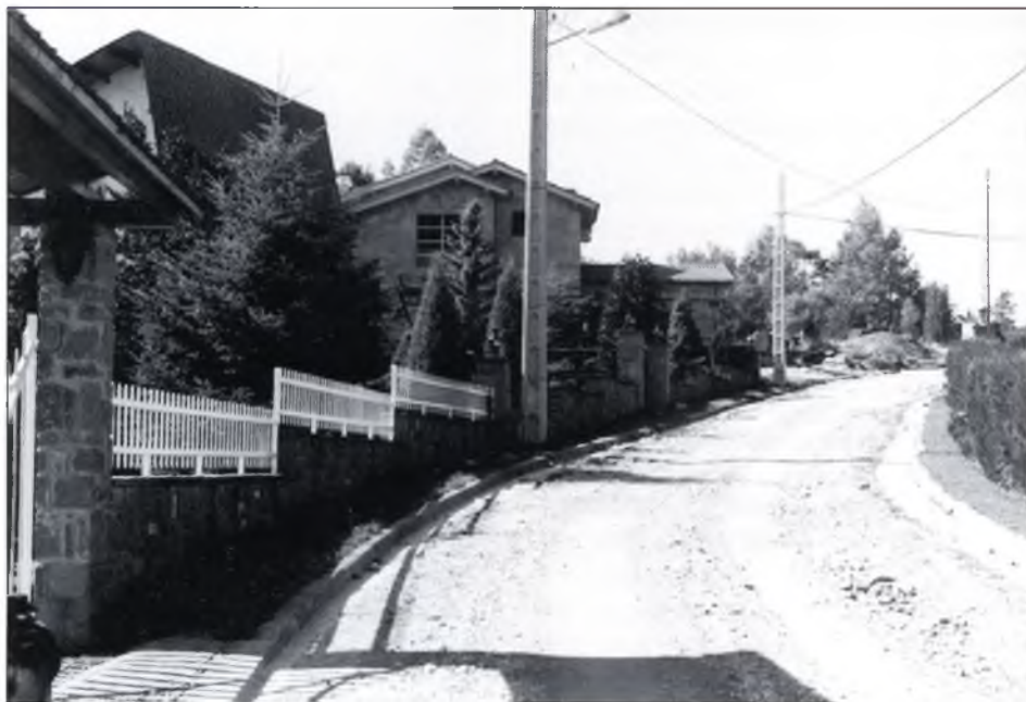
▲ “La qualitat de les edificacions contrasta amb la infraestructura més pròpia d'un suburbi que d'una urbanització de segona residència”

Al cap d'uns dies, cada propietari va rebre una notificació de l'Ajuntament amb l'import exacte de la quota que li correspon pagar i els terminis per a fer-ho. Alhora l'Ajuntament va convocar el 16 de juny un ple municipal en el que es va aprovar el plec de clàusules per al concurs d'adjudicació d'obres del Projecte d'Obres i Serveis de Font Rubí. Aquestes clàusules es publiquen al BOE (27/6), BOP (28/6) i DOG (29/6). Hi queda ben especificat que les obres hauran de durar només un any a partir de la data de replanteig i que el pressupost de contracta és de 344.952.612 ptes., millorable a la baixa.