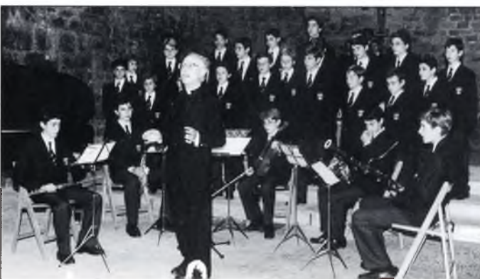
► "L'Escolania de Montserrat, en la primera jornada del Festival".