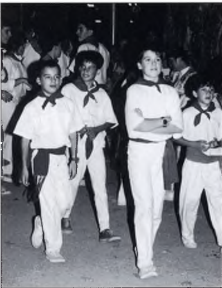
▲ "La "quadrilla" de joves ben plantats".

No obstant, a Camprodon, al Prat, a la manera de les festes de barri de les ciutats, cada cop agafa més empenta la festa que, de fet, significa la cloenda de la temporada. Aquest any ens van muntar l'espectacle insòlit d'una "corrida", on no hi faltava de res, vegin si no les il·lustracions captades per l'objectiu, sempre a punt, de'n Co-