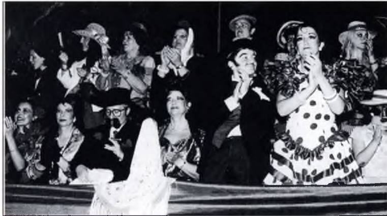
◀ "El palco presidencial on no hi faltava cap de les representacions dels tòpics corresponents."