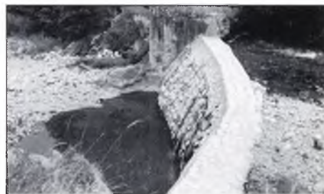
▲ “La mateixa resclosa aquest estiu”