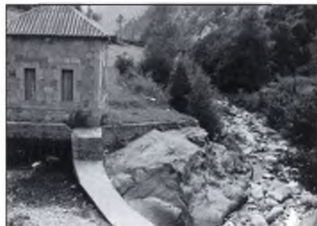
▲ “On és el caudal ecològic?”.