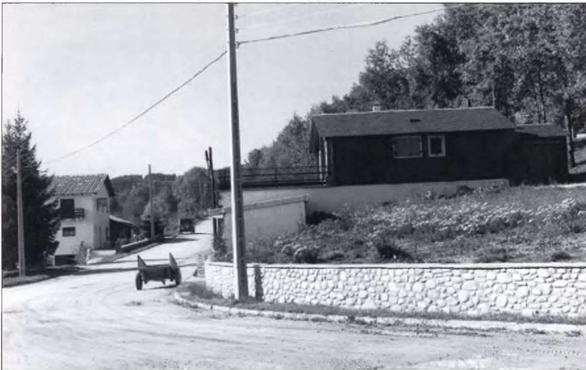
▲ “Les línies aèries, i l'absència de paviment produeixen una deplorable imatge”

Parcel·les per construir: 177, de 97 propietaris