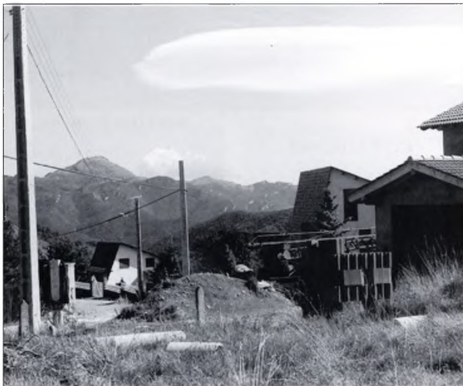
▲ “Una bonica vista del Comanegra des de Font Rubí”