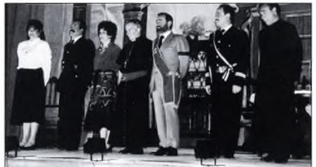
▲ "El Grup de Teatre Camprodon, representà, dins dels actes de la Festa Major, la comèdia "ELS TRES INNOCENTS".

La festa major any rera any va recuperant el to popular que els darrers anys li havia mancat. Ara, per a molts, ja no resulta tan fàcil aprofitar aquests primers dies d'estiu per "anar a la costa", abans del ple de la temporada turística-botiguera de juliol i agost; els fills es resisteixen a deixar el poble i perdre's la festa, i ja sabem que no hi pot haver millor garantia de futur que la participació del jovent. La proximitat de Sant Joan, amb les revetlles celebrades arreu,