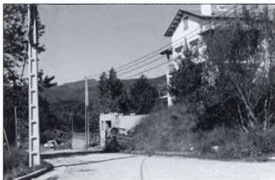
▲ “Una vista de la Urbanització de Font Rubí, on es pot percebre la manca d'una correcta infraestructura”