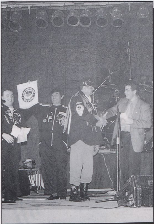
■ Els Merlots s'anticiparen al Carnaval celebrant el seu quinze aniversari.