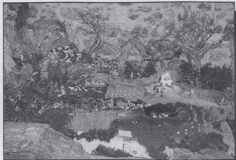
■ Un dels pessebres presentats al concurs de Castell d'Aro.