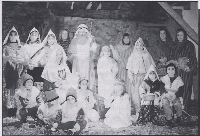
■ Una imatge del quadre del naixement corresponent al Pessebre Vivent de Castell d'Aro d'enguany.