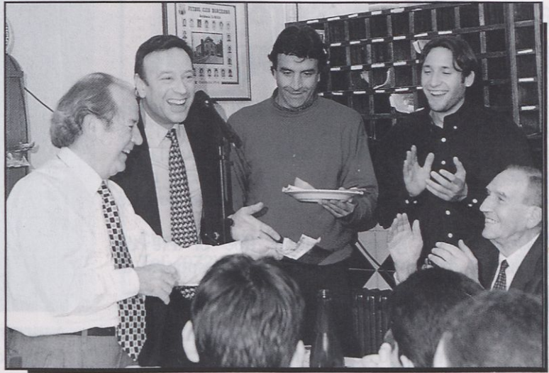
■ Xevi actuà a La Masia els dies previs al Nadal.