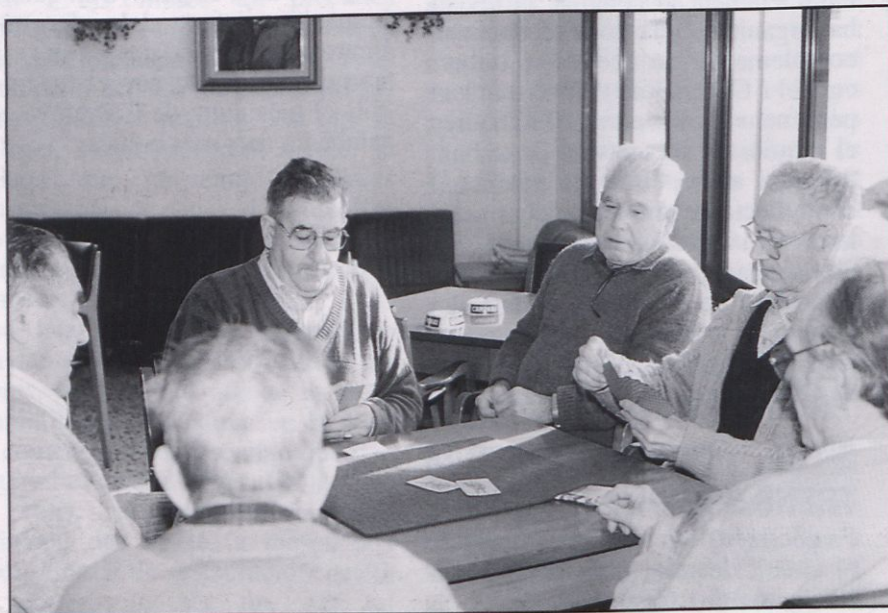
Una partida al Casino Castellerenc.

Després de parlar amb gent de diverses comarques, amb gent de la costa i de muntanya, amb qui