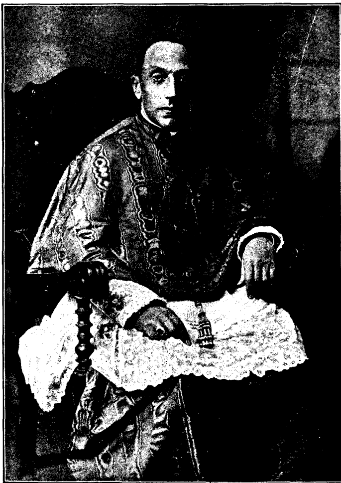
L' EMM. CARDENAL VIDAL I BARRAQUER, METROPOLITÀ DE CATALUNYA, QUI OBTINGUÉ DEL PAPA LA MERCÉ DE LA MISSA DE LA APARICIÓ PER AL NOSTRE SANTUARI