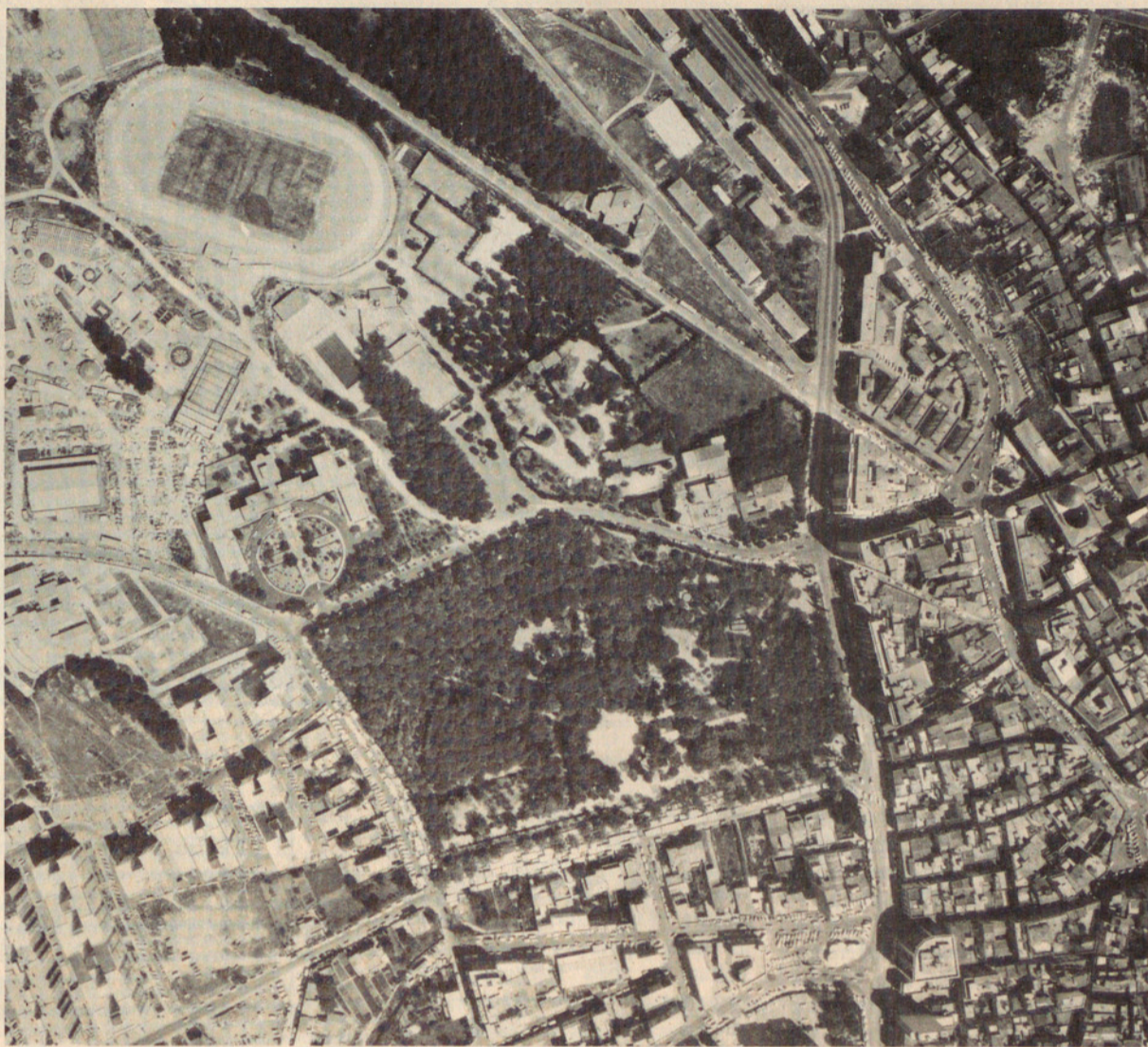
El Parc Bosc Municipal, al bell mig de la fotografia, acollirà aquest any el Pavelló Comercial

Deixant de costat les ja esmentades arrels mercantils de la Santa Creu, si fem un repàs a la història més recent de la ciutat, ens trobem que l'any 1899 es va cele-