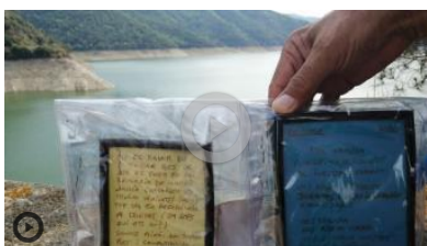
Susqueda: homes que fugien