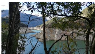
Susqueda: rastreig per buscar més evidències