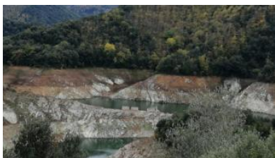
Susqueda: trets i proves sense testimonis humans