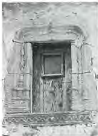
Una finestra molt interessant.

bocí de muralla, o bé paret d'un saló on abans els tot poderosos senyors de vida i mort es mofaven de l'humil pagès de la gleba, també s'esmunyexen pedres nobles, treball d'artistes anònims de passades centúries, i així es vesteixen cases noves amb pedres velles.