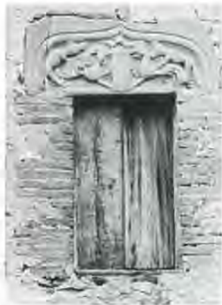
Una guilla i un llop atacant aviram, un escut sense emblemes... Es el primitiu escut de la vegueria de les Guilleries?

Els Comtes-Sobirans s'han imposat damunt els feudals, però el país està assolat, pobre, arruïnat.