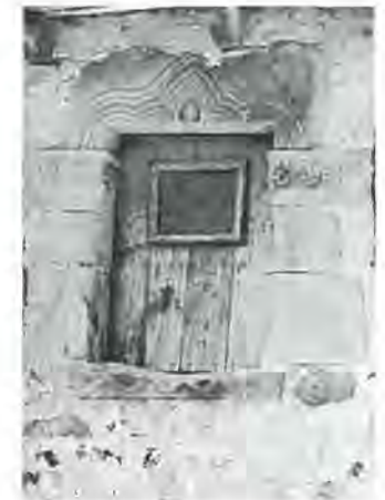
Romànic molt primitiu, qui és el personatge representat?

I el pagès treballa, de nits i de dies, sense donar-se un sol moment de repòs, és un esforç enorme, continuat en el qual pren part tota la família, grans i petits, avis i fadrins.