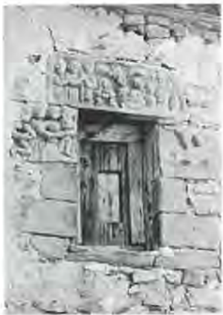
Crucifixió, és una peça, o bé la meitat d'una portallada?

Fan tractes, al pagès no li convé del tot enemistar-se amb el senyor, per això el regateig és llarg i laboriós; aquest bosc, aquella terra de conreu, la font... Els tractes estan ja ultimats, però d'on treurà el pagès les pedres per a bastir la seva llar?