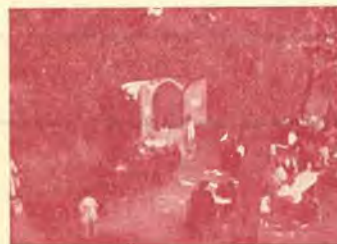
San Hilario Sacalm - Fuente del Pico

Hoteles y Pensiones con todo el confort moderno y espléndidos servicios; toda clase de deportes (tenis, patín...); toda clase de diversiones (selectas reuniones, pistas de baile cerradas y al aire libre, teatros, cine, etc.). Posee, además, una extensa red de comunicaciones que acercan San Hilario a las capitales. * San Hilario es, en fin, el lugar ideal del veraneante y la Fuente de Salud del enfermo.