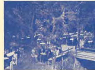
San Hilario Sacalm - Fuente Vieja

Noche, a las 11. AUDICION DE SARDANAS en la Plaza J. Verdaguer por la cobla «Lluïsos» de Taradell y SARDANAS y BAILE en la Piscina. SARDANAS frente la Terraza del Tívoli y seguidamente BAILE DE GALA en el indicado salón.