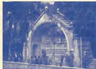
San Hilario Sacalm Fuente Picante n.º 1 - San José