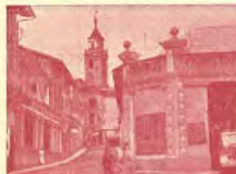
San Hilario Sacalm - Vista Parcial