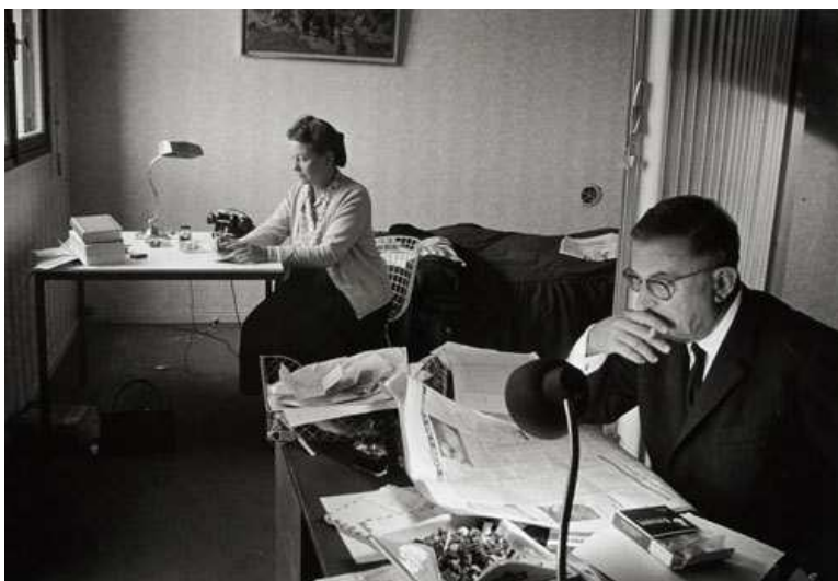
Jean Paul Sartre i Simone de Beauvoir. Paris 1963 .

“Tot ha estat descobert, excepte com viure”