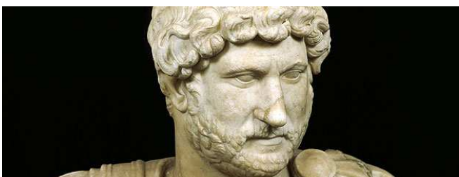
Bust de l'emperador Adrià

La pròpia autora definia així la seva relació amb la novel·la: "gran part de la meua vida transcorrerà en l'intent de definir, després de retratar, a aquest home sol i alhora vinculat amb tot"