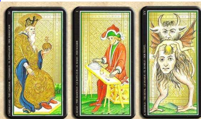
Tarot de Visconti

http://aletheiamuip.com/escritores/italo-calvino/