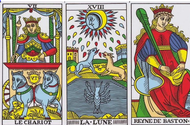
Tarot de Marsella