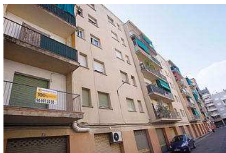
La comunitat de veïns està ubicada al centre de Salt. marc martí

L'Ajuntament va inspeccionar aquest hivern 409 pisos on podia haver-hi problemes de salubritat. Els habitatges eren de 22 comunitats d'on havien rebut queixes o denúncies per brutícia, amuntegaments o presència de plagues.