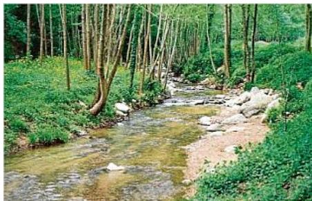
La riera d'Arbúcies amb història, paisatge i frescor en aquests dies de tanta xafogor. esteve puig

Passejades guiades a la fresca vorejant la riera d'Arbúcies constitueixen la nova proposta ecològica i cultural, realitzada ahir, del Museu Etnològic del Montseny, perquè tant autòctons com forasters es poguessin endinsar fàcilment en un espai natural de gran bellesa i que malgrat la seva proximitat per la gent d'aquí és per a molts encara desconegut. A través d'una curta caminada pel costat del tram urbà de la riera, els assistents van poder fixar-se en els aspectes naturals que la fan especial, però també en aquells elements vinculants com els aprofitaments econòmics, espai de lleure, font de llegendes i mites.