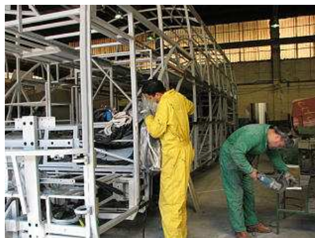
La indústria carrossera és el puntal econòmic del municipi. acn

Arbúcies és un municipi de 6.652 habitants, amb un atur registrat al maig del 12,97%, lleugerament inferior al registrat el mes de gener d'aquest any. Del total de les pimes del municipi, 53 són empreses del sector industrial metal·lúrgic. El 46,3% de les empreses d'Arbúcies formen part del clúster carrosser. La dependència econòmica familiar cap a aquest sector és important ja que dins la unitat familiar és habitual que, com a mínim, un dels membres hi treballi. La resta del sector empresarial es distribueix de la següent manera: 96 pimes són comerços dirigits per autònoms i nuclis familiars; 36 empreses pertanyen al sector turístic; 21 situen la seva activitat dins el sector de la construcció, i 3 estan vinculades a l'activitat forestal, agrària i ramadera. Les 65 pimes restants, a banda de les 53 que s'ubiquen dins el sector industrial carrosser, pertanyen al sector serveis i, com el comerç, són petites societats familiars o propietats d'autònoms.