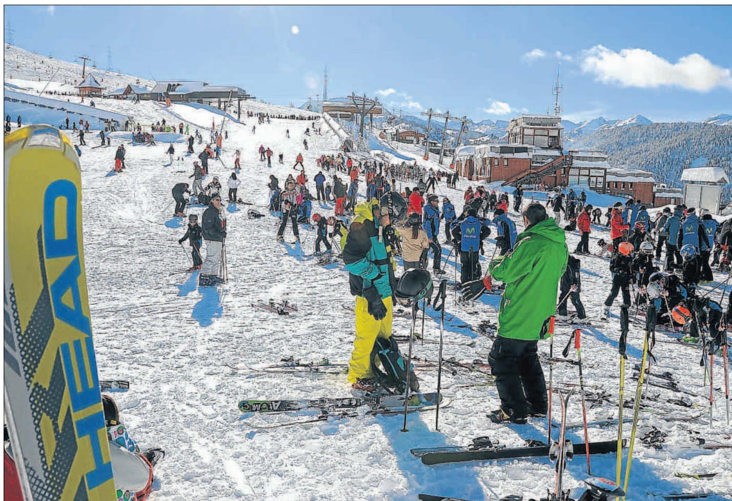
Alta densitat. Les pistes de Baqueira van rebre una notable aflluència d'esquiadors durant el pont de la Constitució